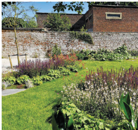
Verweerde tuinmuren in de achtertuin Jette