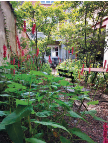
Patio in een architectenbureau in Etterbeek