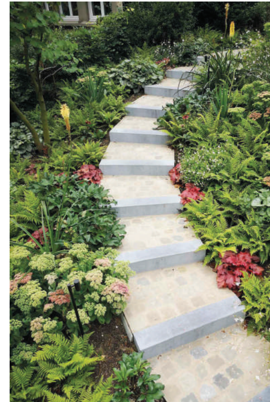
De trap in deze voortuin in Anderlecht wordt geflankeerd door een subtiele variatie van bladkleuren en -texturen

Tekst: Paul Geerts