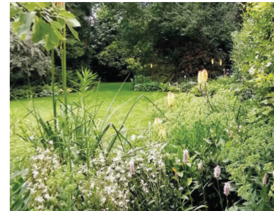
De tuin lijkt groter door de grote oude bomen