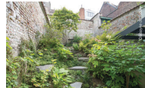
Een groene tuin tussen vier muren in hartje Brussel