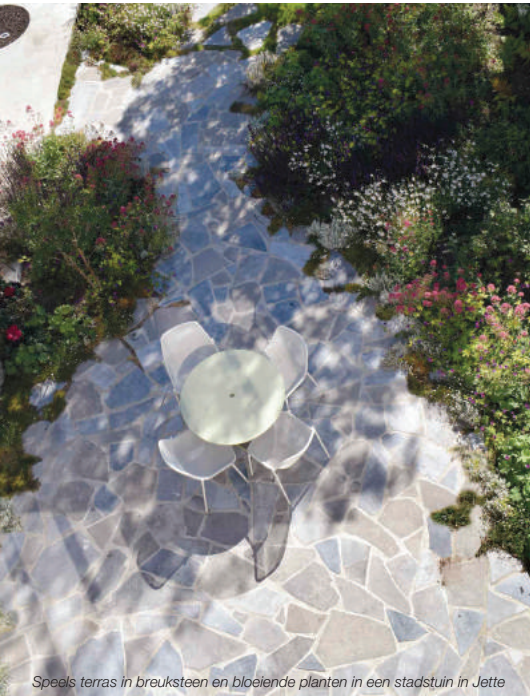
Speels terras in breuksteen en bloeiende planten in een stadstuin in Jette