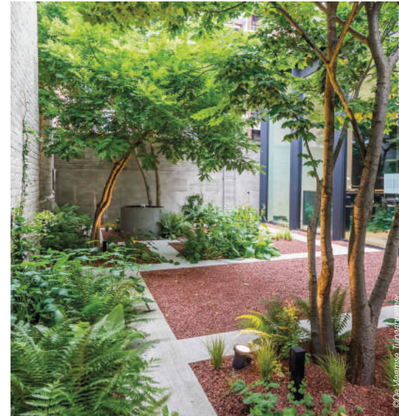
Ommuurde stadstuin bij een architectenbureau in Gent