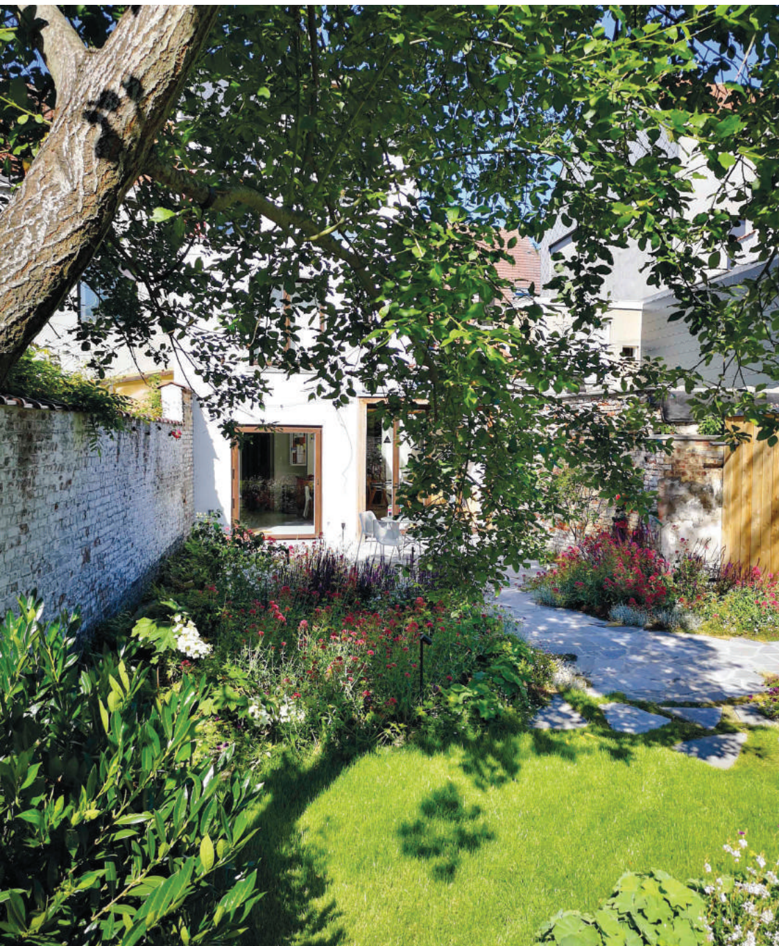
Bloemenrijke stadstuin in Jette