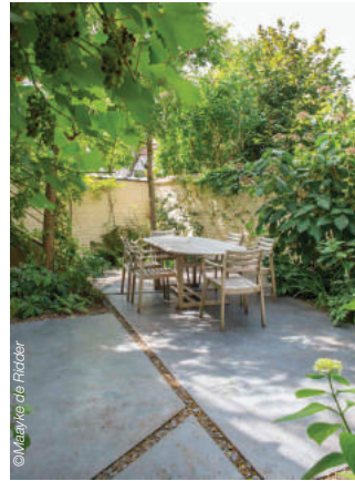
Een geometrisch patroon van beton- en plantvakken in hartje Brussel

Veel stadstuinen worden bijvoorbeeld langs alle kanten omsloten door muren. “Het zijn vaak kleine hokjes tussen vier muren. Het is dan belangrijk om die muren op een originele manier bij het ontwerp te betrekken. We willen ze zeker niet wegsteunen omdat het vaak om mooie oude muren gaat, maar tegelijk willen we vermijden dat men zich helemaal ingesloten voelt.” In een van zijn eerste tuinen in het centrum van Brussel werkte hij daarom met een geometrisch patroon van grote betonvlakken afgewisseld met plantvakken, waarvan sommige tot tegen de muren komen en andere niet. De plantvakken zijn weelderig beplant met bloeiende en geurende heesters, varens en vaste planten. “Dat zorgt voor een dynamiek in deze kleine ruimte waarbij je de muren wel ervaart maar door de weelderige beplanting het groene tuinbeeld toch overheerst. Ook de drie blaasjesbomen ( Koeleruteria paniculata ), die intussen groot zijn geworden, dragen daartoe in hoge mate bij.” Vanuit de leefruimte op de eerste verdieping overheerst het groen en zijn de muren nog nauwelijks te zien. Hij ontwierp ook een metalen passerelle bij de leefruimte waar de bewoners tussen de kruinen van de koeleruteria's kunnen zitten en genieten van hun tuin. Een opvallend detail is een betonnen vijver langs de hele diepte van de tuin. De klimplanten die een weg zoeken langs de muren worden weerspiegeld in het watervlak, terwijl een fonteintje de stadsgeluiden filtert.